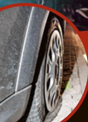
Der linke Hinterreifen ist platt, auch im Kotflügel ist ein Loch. Mehrere Schüsse waren nötig, um den Raser zu stoppen